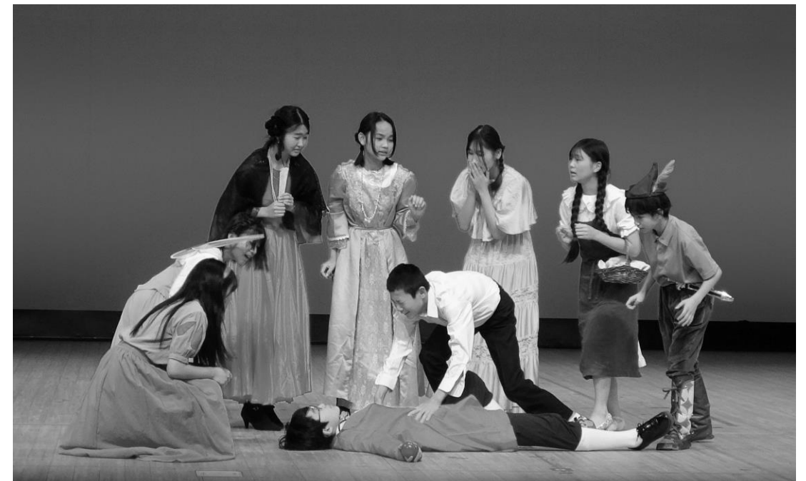
『白雪姫? ～You can fly! ～』